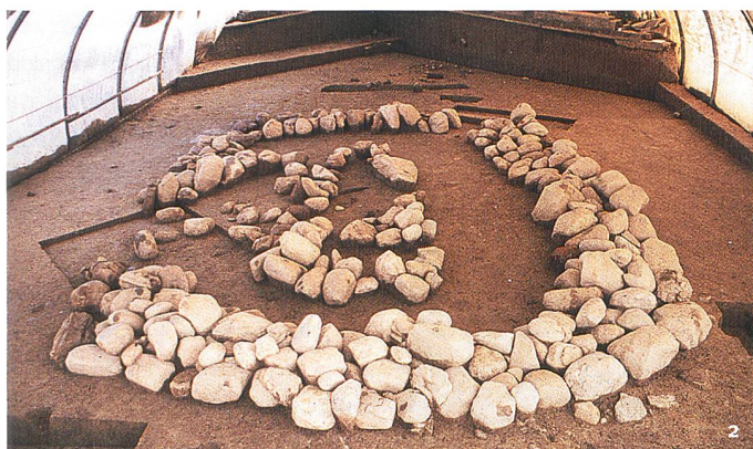
Fig. 2 Vue générale de l'«enclos» funéraire 8, l'un des plus massifs de la nécropole.

Gesamtansicht der «Umfriedung» von Grab 8 – eine der wichtigsten der Nekropole.