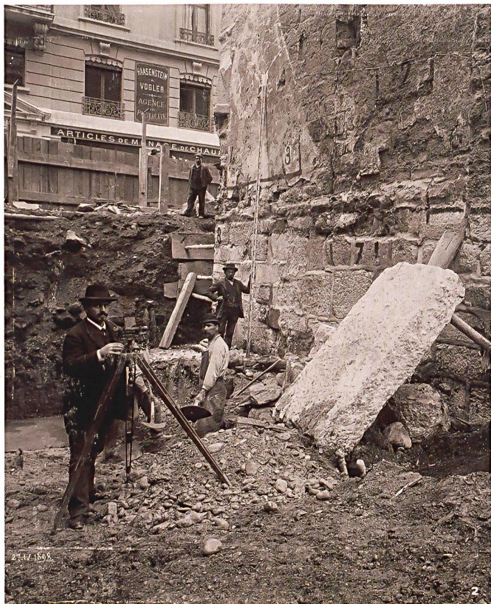
Fig. 2 Vue des fondations de la Tour de l'Île, dégagées en 1898.

Ansicht des Fundaments der Tour de l'Île, freigelegt im Jahre 1898.