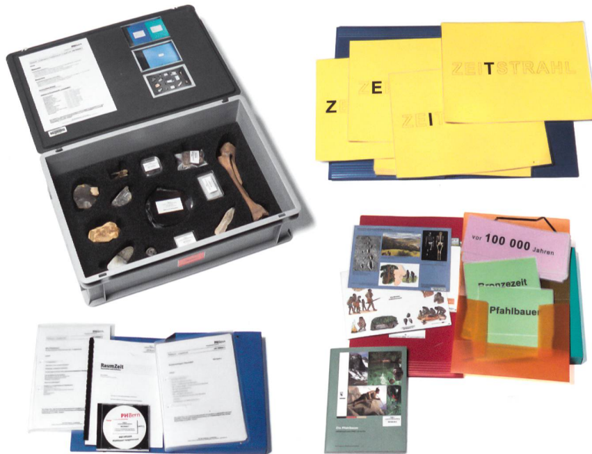
Abb. 2 Archäologiekoffer «Die Pfahlbauer»: Können Kinder archäologische Funde untersuchen, tauchen sie mit all ihren Sinnen in die Epoche ein.

Valigia archeologica «I lacustri»: i bambini possono esaminare i reperti archeologici e immergersi in un'altra epoca.