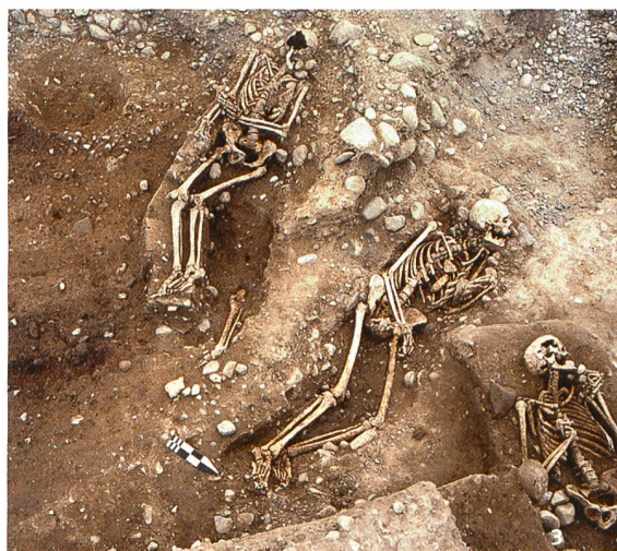
Fig. 3 Trois inhumations du cimetière A la Montagne (30/40-70/80 apr. J.-C.).

Les ouvrages consacrés aux grands monuments d'Aventicum constituent l'une des séries majeures des publications parues ces dernières années. Ainsi, après celles du sanctuaire du Cigognier (1982) et de l'amphithéâtre (2004), Philippe Bridel livre l'étude architecturale du sanctuaire de la Grange des Dîmes. Ce dernier comprend deux temples dits «mixtes», c'est-à-dire présentant à la fois le plan concentrique à galerie périphérique typique du fanum gallo-romain, et le podium et le porche d'entrée ( pronaos ) caractéristiques des temples romains «classiques».