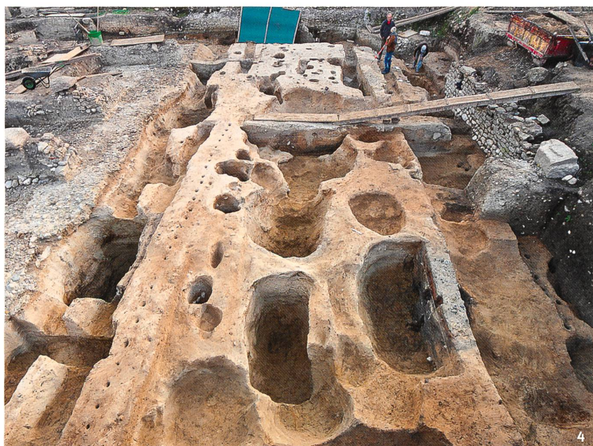
Fig. 4 Les fouilles réalisées en 2014 au pied de la colline d'Avenches (route du Faubourg) ont livré un ensemble de fosses, de fossés et de palissades ainsi qu'un très riche mobilier de La Tène D2.

Die 2004 durchgeführten Grabungen am Fuss des Hügels von Avenches (route du Faubourg) haben ein Ensemble von Gräbern, Gräben und Palisaden sowie reiche Funde aus der jüngeren Eisenzeit (Latène D2) zutage gebracht.