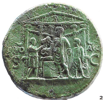
Fig. 2 Sesterce de Caligula mis au jour dans le sanctuaire de la Grange des Dîmes. Au revers de cette pièce, frappée à Rome en 37-38 apr. J.-C., on peut voir l'empereur faisant un sacrifice à l'occasion de l'inauguration du temple d'Auguste divinisé.

Sesterz von Caligula aus dem Sanktuarium von la Grange des Dîmes. Auf der Rückseite dieser in Rom 37-38 n.Chr. geschlagenen Münze kann man den Kaiser bei einer Opferhandlung anlässlich der Einweihung eines dem Gottkaiser Augustus gewidmeten Tempels erkennen.