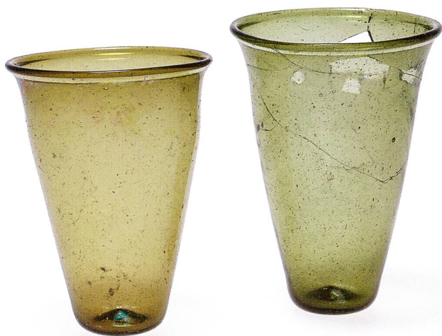
Abb. 20 Basel-Theodorskirchplatz 7, 2010/11, die Trinkgläser aus den Kindergräbern 1 (links) und 6.

Basilea-Theodorskirchplatz 7, 2010/11, bicchieri rinvenuti nelle sepulture di bambino 1 (a sinistra) e 6.