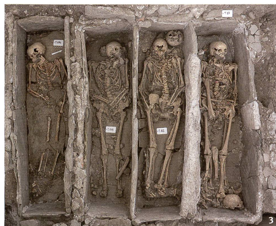
Fig. 3 Esplanade de Saint-Antoine, ensemble de tombes de la galerie ouest.

tombes sont parfois accompagnées de leur pierre tombale, dont l'une porte encore une inscription caractéristique des 6 e -7 e siècles. Ces dalles restituent le niveau de marche à l'intérieur de l'édifice paléochrétien et fournissent un témoignage extrêmement précieux pour la compréhension d'un tel complexe funéraire, qui a pu rester en usage, dans nos régions, jusqu'au 9 e siècle. Le troisième ensemble d'inhumations correspond à des fosses simples ou des coffrages de bois bordés de pierres de calage, typiques de sépultures des 10 e -12 e siècles, auxquels il faut associer quelques ensevelissements multiples, vraisemblablement réservés aux victimes d'épidémies. Ces tombes recouvrent surtout le secteur nord-ouest de l'église, prouvant la ruine de cette partie du bâtiment, qui se voit progressivement envahie par l'extension du cimetière. On ne sait pas si ce constat implique l'abandon complet ou seulement partiel de l'édifice primitif au tournant du premier millénaire.