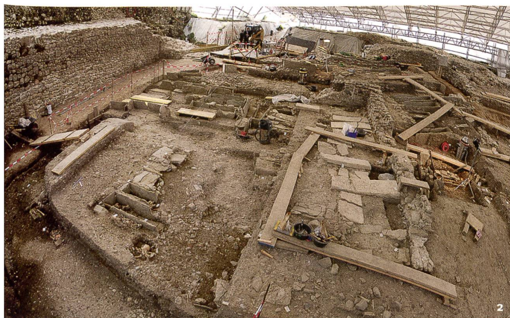
Fig. 2 Esplanade de Saint-Antoine, galerie ouest de l'église avec ses pierres tombales, vue du nord.