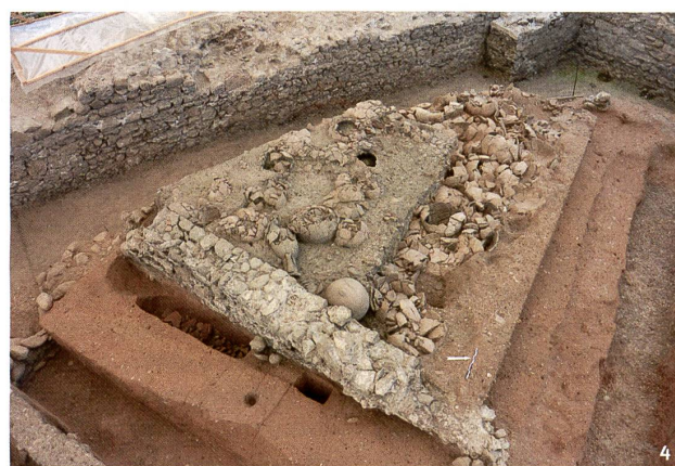
Fig. 4 Esplanade de Saint-Antoine, vide sanitaire gallo-romain, seconde moitié du 1 er s. apr. J.-C.