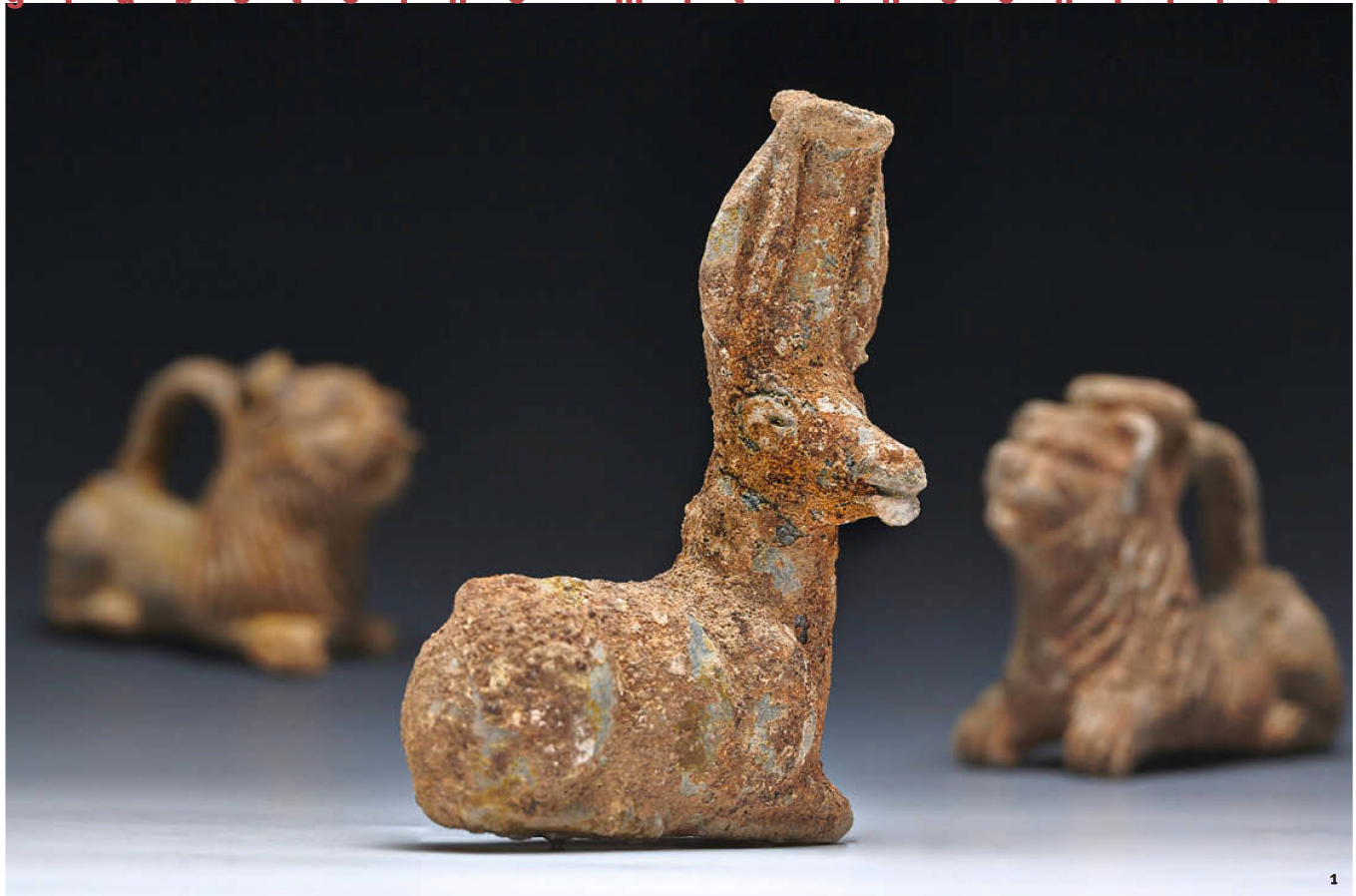
Abb. 1 Bleiglasierte Balsamarien in Tiergestalt aus den römischen Brandgräbern.

g r a b s t e i n e m i t i n s c h r i f t