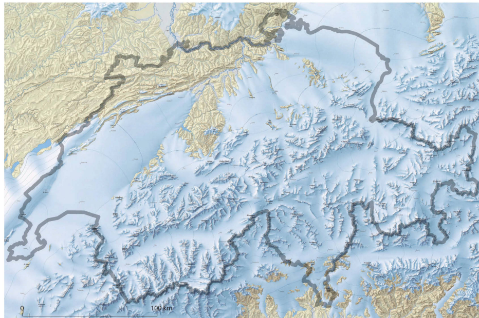
Fig. 2 Aucune place pour l'être humain durant l'extension maximale des glaciers vers 20000 av. J.-C.

La vie de l'homme dans la région est beaucoup mieux connue au Néolithique (5500-2200 av. J.-C.) et à l'âge du Bronze (2200-850 av. J.-C.), grâce aux vestiges de plus de 50 villages lacustres répartis sur 32 sites au bord du lac de Zoug. Les riches découvertes archéologiques offrent des vues fascinantes sur la vie quotidienne de communautés marquées par des innovations révolutionnaires: la culture de céréales, la sédentarité, l'élevage d'animaux, notamment de moutons, de chèvres, de bœufs et de cochons, la production de céramique et le travail du métal. Grâce à la hache d'apparat de Cham-Eslen (fig. 35), unique à l'échelle européenne, des références culturelles remontant à plus de 6000 ans peuvent être établies jusqu'aux rives de la mer Noire. Les artefacts archéologiques sont certes des «empreintes de pieds» immédiates qui prouvent l'existence de l'homme préhistorique, mais beaucoup d'aspects de son cadre de vie et surtout de ses idées se révèlent à nous uniquement à travers l'établissement d'analogies. Est-ce que la semelle en mousse «contre les rhumatismes» est le moyen d'une personne en particulier de se prémunir du froid ou est-ce que les chaussures