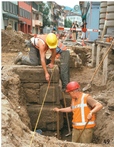
Abb. 49 Bauuntersuchungen und die Begleitung von Werkleitungsgrabungen führen immer wieder zu wichtigen Erkenntnissen zur Geschichte der Stadt Zug: 2004 wurden bei der Sanierung der Neugasse die Fundamente des 1478 errichteten und 1873 abgetragenen Baarertors (Neutor) entdeckt.

Le indagini sugli edifici e la supervisione archeologica in occasione di lavori alle canalizzazioni portano spesso a nuove scoperte sulla storia della città di Zug: durante i lavori di miglioria della Neugasse nel 2004 sono venute alla luce le fondamenta della porta di Baar (porta Nuova), costruita nel 1478 e distrutta nel 1873.