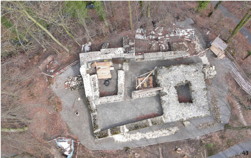
Abb. 43 Flugaufnahme der Burgruine Hünenberg kurz vor Abschluss der Restaurierung 2009: Die Reste der ersten Ringmauer, die entlang der Hangkante verlief, sind nur schwach zu erkennen. Der grösste Teil des Baubestandes stammt aus dem 13. Jh. bzw. von den Restaurierungen in den 1940er und 1960er Jahren.

Fotografia aerea del castello di Hünenberg poco prima della fine del restauro nel 2009: i resti del primo muro di cinta, che correva lungo la scarpata, sono difficilmente visibili. La maggior parte dei resti conservati risale al XIII secolo oppure è dovuta ai restauri degli anni 1940 e 1960.