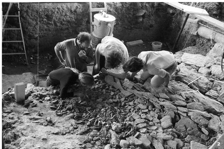
Fig. 2 Sion, Petit-Chasseur I, 1971. Déga- gement d'un amas d'os humains brûlés déposés dans une fosse le long du soubassement du dolmen M VI.

Sion, Petit-Chasseur I, 1971. Freilegen einer Ansammlung verbrannter menschlicher Knochen, die in einem Graben längs des Fundaments von Dolmen M VI zum Vorschein kamen.