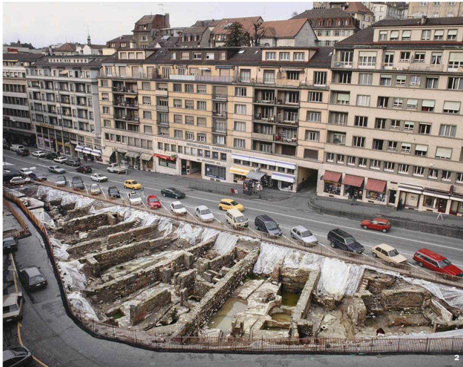
Fig. 2 Lausanne – Rôtillon. Les fouilles de 1996 ont révélé l'histoire d'un quartier au bord du Flon, du Moyen Âge au 20 e siècle.

Losanna – Rôtillon. Gli scavi del 1996 hanno messo in evidenza la storia di un quartiere lungo il Flon, tra il Medioevo e il XX secolo.