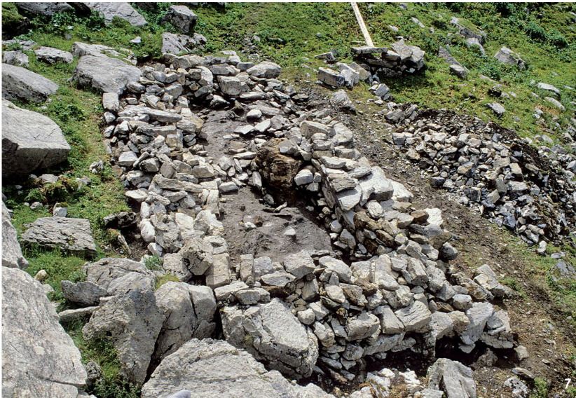
Abb. 7 Melchsee-Frutt-Kerns (OW). 1920 m ü.M. Wüstungsplatz Müllerenhütte. Zweiräumiges Gebäude G7, von NW. Im Vordergrund der Raum zum Kaltstellen der Milch, im Hintergrund die «Käserei» mit Feuerstelle und stirnseitigem Zugang.

Melchsee-Frutt-Kerns (OW). 1920 m s.m. Plaz da desertificaziun Müller- hütte. Edifizi da duas stanzas G7, da nordvest. En la part davant il local per tegnair frestg il latg, en il fund la «chascharia» cun fuaina ed entrada da la vart frontala.