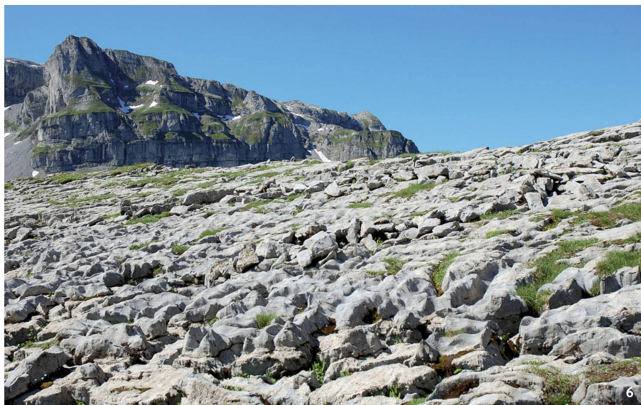
Abb. 6 Muotathal-Glattal (SZ). 1890 m ü.M. Reste einer ehemaligen Pferchmauer auf blanken Karrenfelsen.

Muotathal-Glattal (SZ) 1890 m s.m. Restanzas d'in anteriur claus da mir sin grip glazial niv.