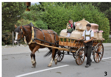
Abb. 3 Alpabfahrt im Jahr 2009 in Appenzell (AI). Der so genannten Lediwagen ist vollbeladen mit blendend weiss geschrupptem hölzernem Milchgeschirr, einem Butterfass und einem kupfernen Käsekessel – dem einzigen Gegenstand aus Metall.

Descensiun da l'alp l'onn 2009 ad Appenzell (AI). L'uschenumnà «Lediwagen» è chargià cun vaschs da latg da lain barschunads resch alv, ina panaglia ed ina chaldera d'arom – il sulet object da metal.