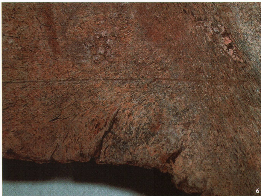
Abb. 6 Muotathal-Knochenloch. Deutlich sichtbare Schnittspur auf dem Schulterblatt eines Steinbocks, 2. Jahrtausend v.Chr. Länge total 5 cm.

Muotathal, Knochenloch. La trace de découpe est bien visible sur l'omoplate d'un bouquetin, 2 e millénaire av. J.-C. Longueur totale: 5 cm.