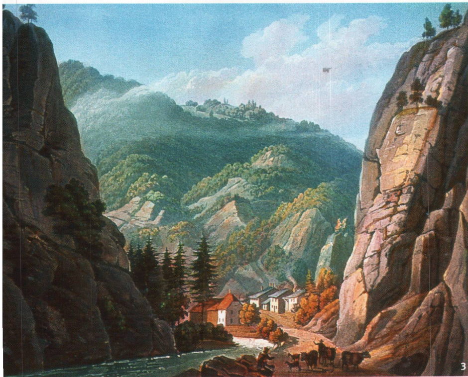
Abb. 3 Die Glashütte von Rebeuvelier an der Birs, um 1836. Kolorierter Stich von Winterlin, Schreiber und Walz, Basel.

La vetreria di Rebeuvelier, sulle rive della Birse, attorno al 1836. Incisione acquerellata di Winterlin, Schreiber e Walz, Basilea.