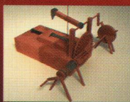
Leonardo da Vinci