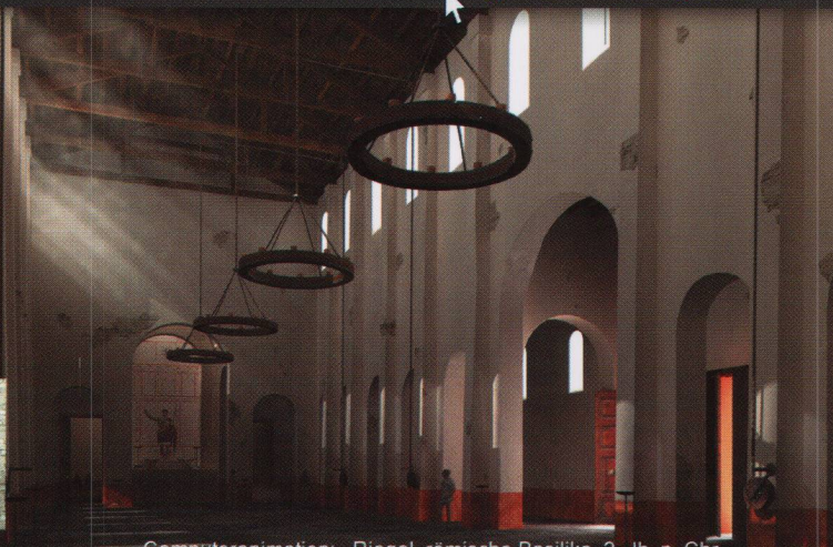
Computeranimation: Biegel, römische Basilika, 2. Jh. n. Chr.