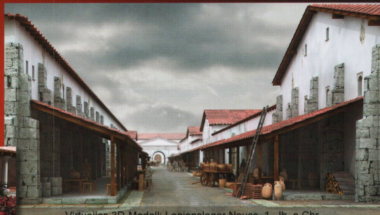
Virtuelles 3D-Modell: Legionslager Neuss, 1. Jh. n.Chr.