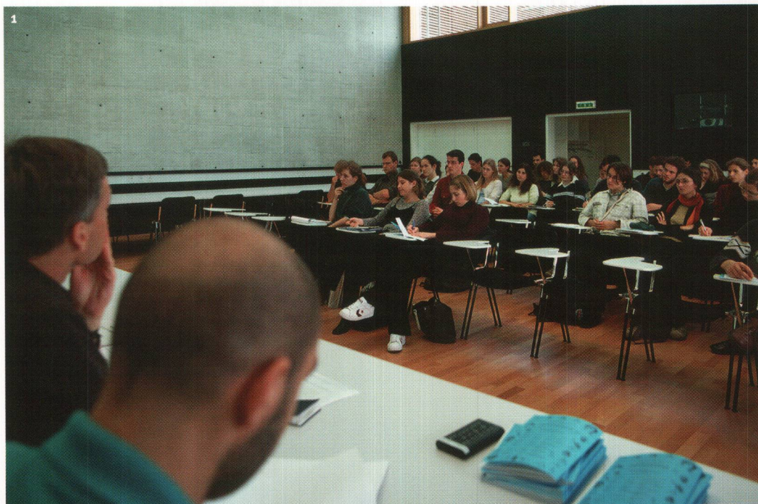
Fig. 1 Salle de cours et de conférences du Laténium.

Le Laténium au service de l'Institut A l'Université de Neuchâtel, l'enseignement de l'archéologie est assuré par deux instituts qui dispensent, de manière complémentaire, cours, séminaires et travaux pratiques