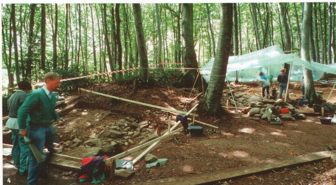
Fig. 4 Fouille-école sur le site de Vernéaz-La Redoute des Bourguignons (Vaumarcus, NE).

de l'A5. Sur le plateau de Bevaix, notamment, la plupart des étudiants concernés ont pu être directement intégrés comme stagiaires dans les équipes de fouilles professionnelles. La diminution progressive de ces travaux de terrain de grande ampleur n'a pas pour autant signifié la fin des possibilités, pour les non-initiés, de «faire de l'archéologie». En 2000-2001, les fouilles cantonales ont ainsi réservé, dans leur programmation, un volet didactique qui a permis d'accueillir les représentants des dernières promotions académiques.