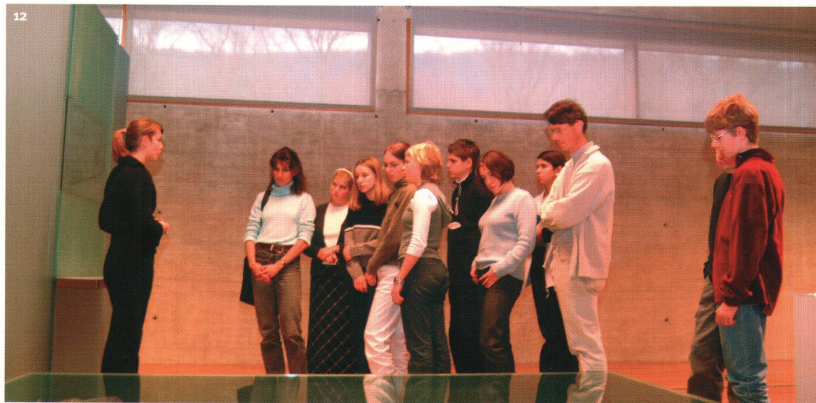
Fig. 12 Visite guidée dans les salles d'exposition.