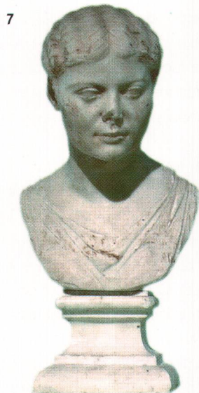
Fig. 7 Buste romain en marbre. Busto di marmo d'epoca romana.

L'itinéraire historique du pays de Neuchâtel commence avec le Château et la Collégiale et met l'accent sur le patrimoine bâti, sur l'architecture