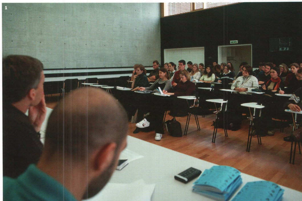
Fig. 1 Salle de cours et de conférences du Laténium.

A l'Université de Neuchâtel, l'enseignement de l'archéologie est assuré par deux instituts qui dispensent, de manière complémentaire, cours, séminaires et travaux pratiques