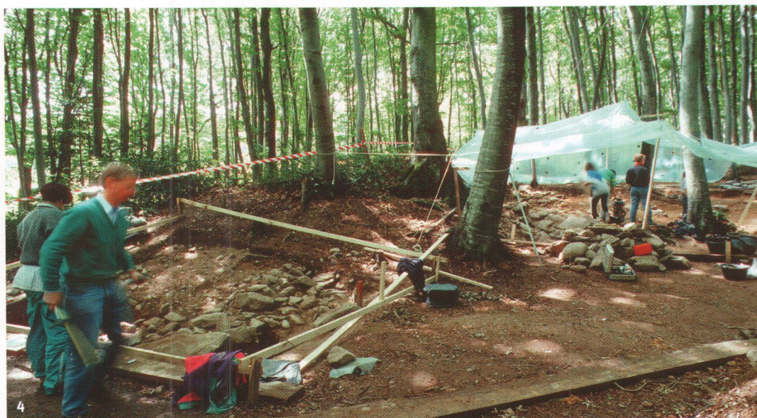
Fig. 4 Fouille-école sur le site de Vernéaz-La Redoute des Bourguignons (Vaumarcus, NE).

de l'A5. Sur le plateau de Bevaix, notamment, la plupart des étudiants concernés ont pu être directement intégrés comme stagiaires dans les équipes de fouilles professionnelles. La diminution progressive de ces travaux de terrain de grande ampleur n'a pas pour autant signifié la fin des possibilités, pour les non-initiés, de «faire de l'archéologie». En 2000-2001, les fouilles cantonales ont ainsi réservé, dans leur programmation, un volet didactique qui a permis d'accueillir les représentants des dernières promotions académiques.