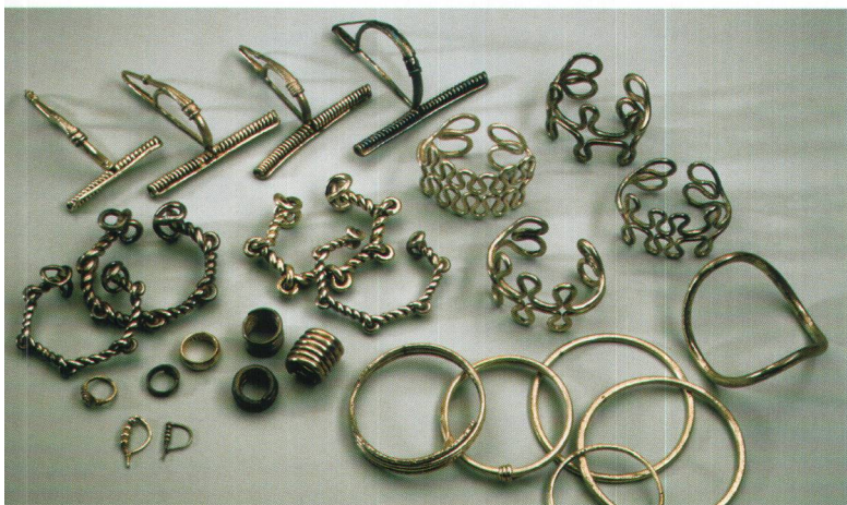
Fig. 3 Gioielli in argento da varie tombe di Giubiasco; II – I secolo a.C.