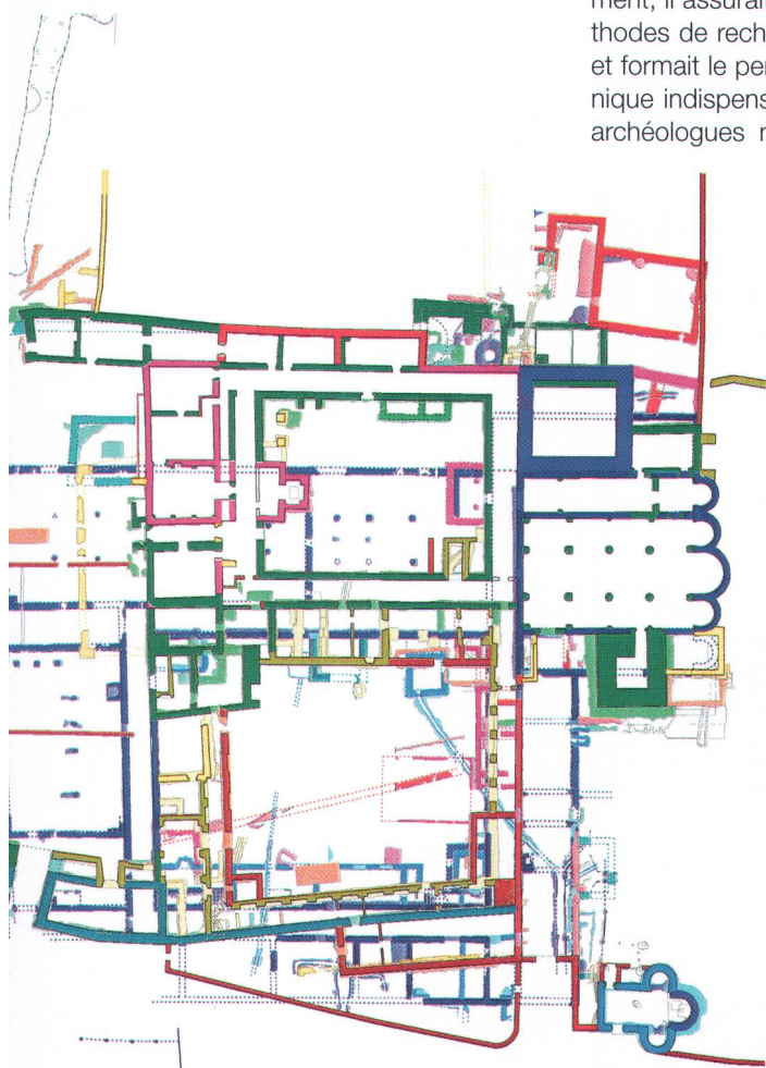
Abb. 1 Mit der archäologischen Forschung gewinnt das mittelalterliche Kloster St. Johann in Müstair GR an Farbe und Bedeutung: Bronzezeitlicher Pfostenbau (rot) - spätantiker Pfostenbau (grün) - karolingisches Kloster (blau) - ottonischer Wohn- und Wehrturm (violett) - hochmittelalterliche Bischofsresidenz (rosa) - spätmittelalterliches Kloster mit barocken Zubauten (grün, gelb). Aus: Veröff. Inst. Denkmalpflege ETH Zürich 16.1 (Zürich 1996), erweitert. L'étude archéologique du couvent médiéval de St Jean à Müstair a permis de mieux comprendre l'importance de ce lieu.