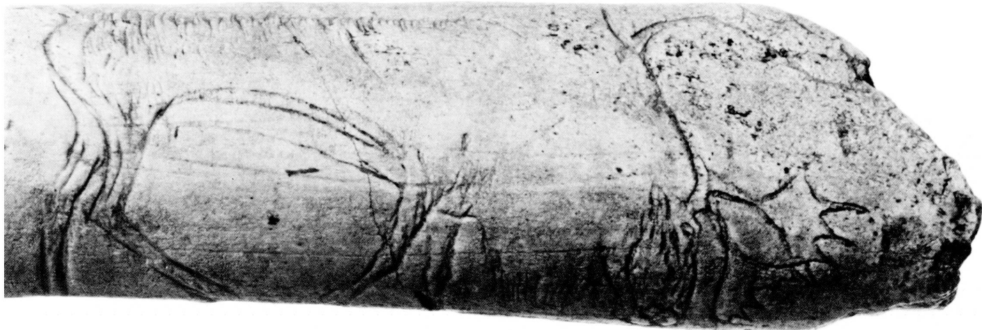
fig. 1 Gravure de renne sur un bâton percé en bois de renne. Grotte du Kesslerloch SH (Magdalénien supérieur). L. 8,5 cm. Rentier, vom Kesslerloch SH. Renna, dal Kesslerloch SH.

– estimation des masses de viande consommable etc.