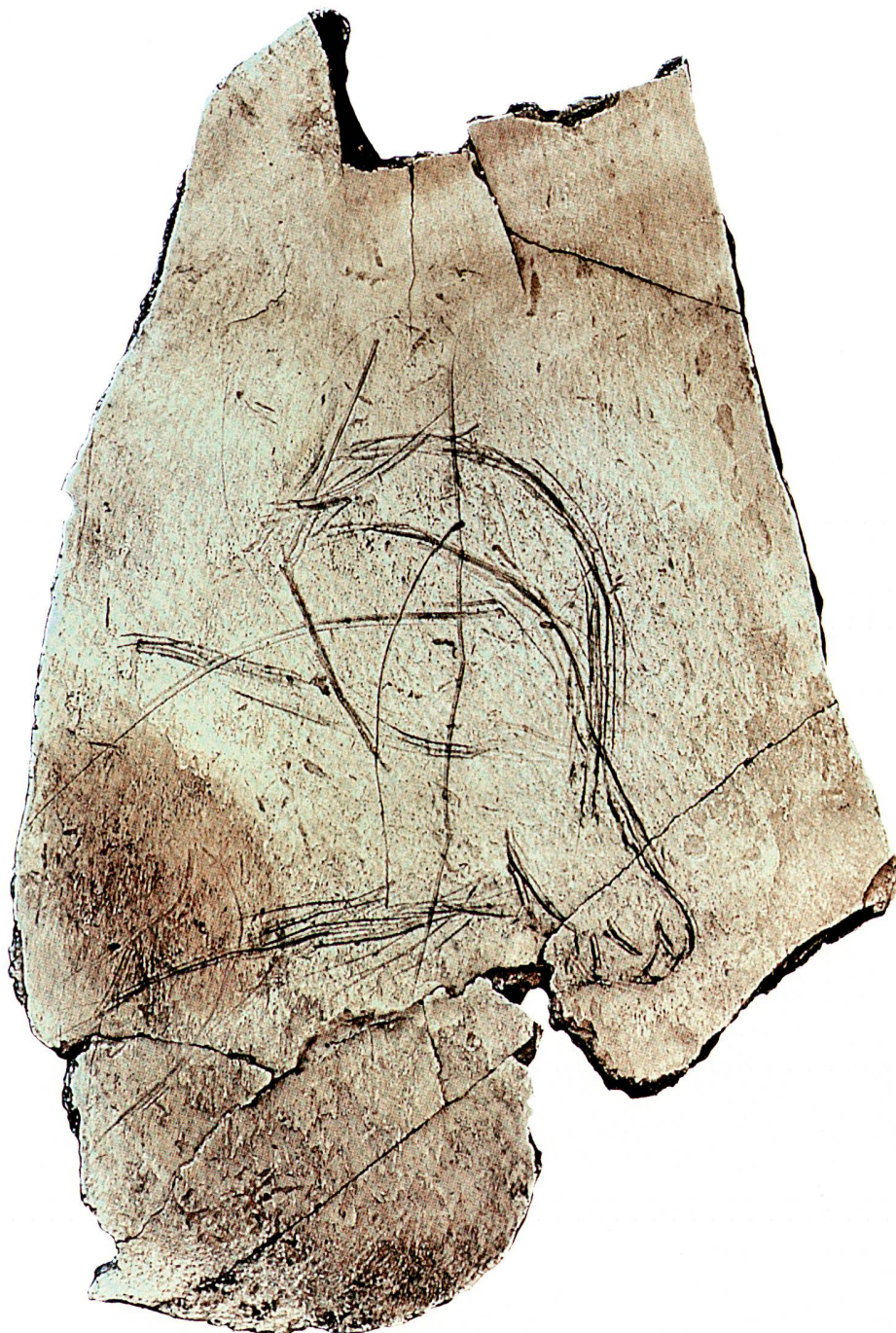
fig. 4 Tête de bouquetin gravé sur os. Risliisberghöhle SO (Magdalénien supérieur). Ech. 2:1. Kopf eines Steinbocks, aus der Risliisberghöhle SO. Testa di un stambecco, dalla Risliisberghöhle SO.

tation sur la chasse plus aisée des petits animaux.