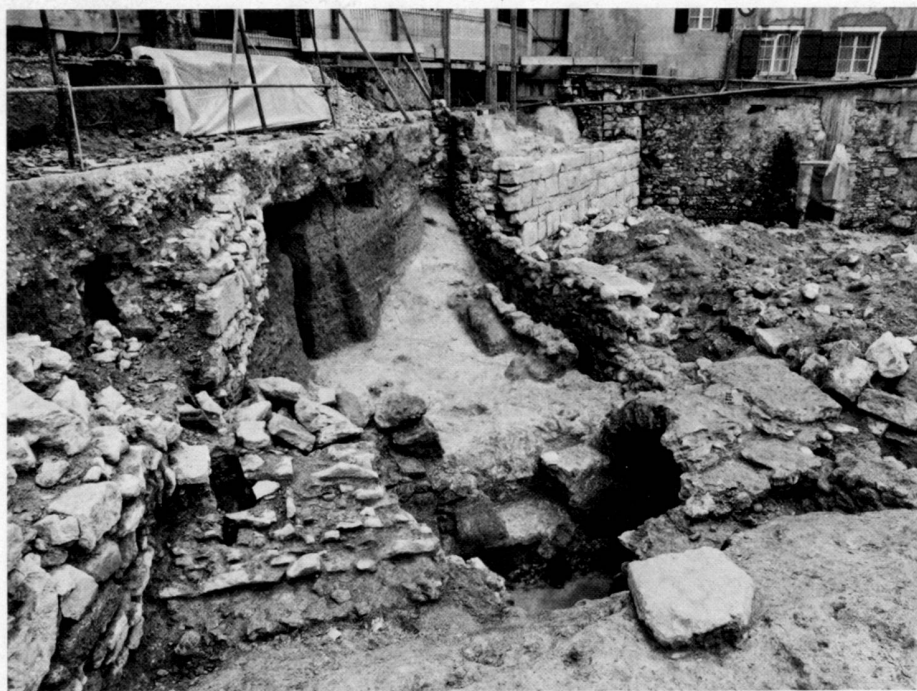
Biel-Rosiusplatz. Blick in Zufahrtsrichtung zum alten Nordtor von Biel. Hinten neben der Fahrverbotstafel das heutige Besentöri. Rechts der mit Bauschutt gefüllte Graben zwischen Burg und Altstadt.