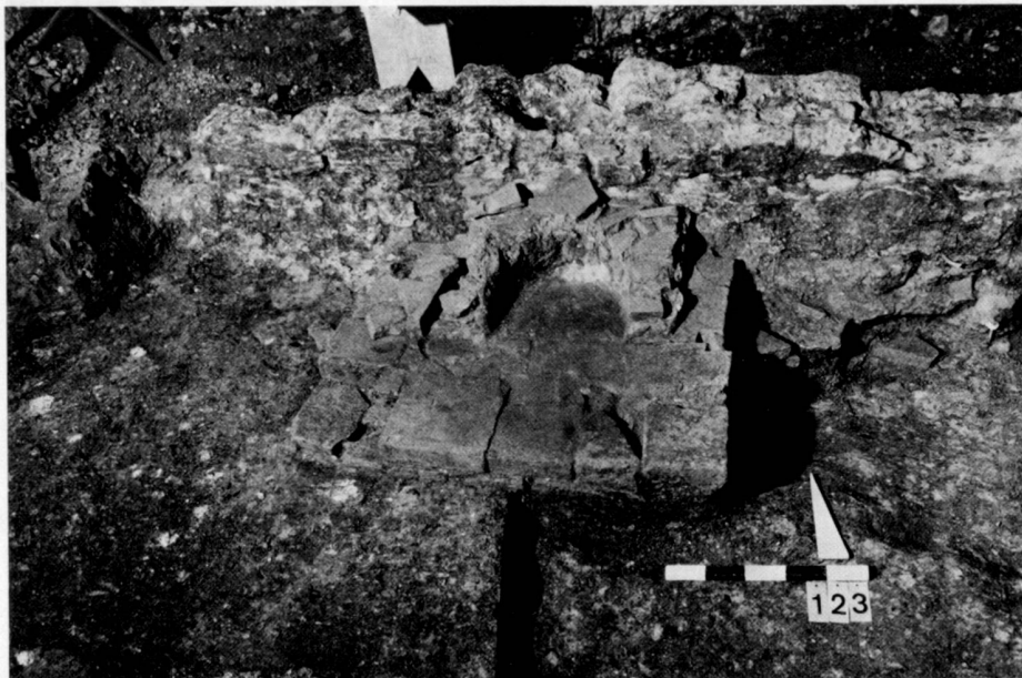
Herdstelle im Innenraum einer Manipelkaserne (nördliches Seitenschiff).