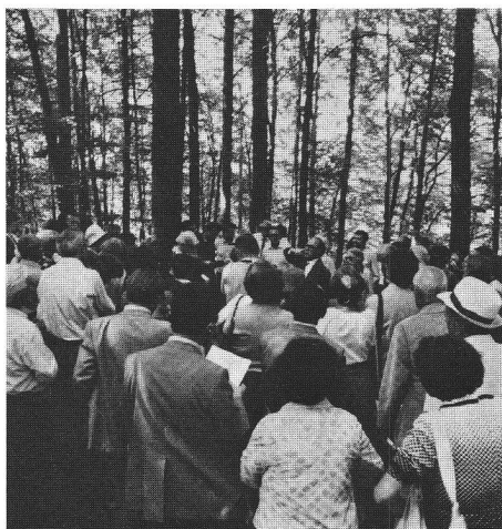
Im Banne der Ausführungen von Dr. W. Drack