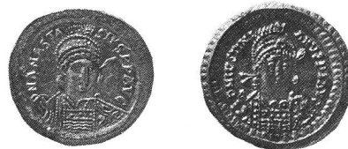
Solidus de Anastase (491-518) frappé à Constantinople (à gauche). – Solidus de Justinien (527-565) frappé à Constantinople (à droite). Ech. 1:1.

Une autre partie de cette nécropole, aux tombes orientées Est-Ouest, a été fouillée en 1974. Il pourrait s'agir des éléments chrétiens de la population locale (voir JbSGUF 1976 p. 274). D. Weidmann