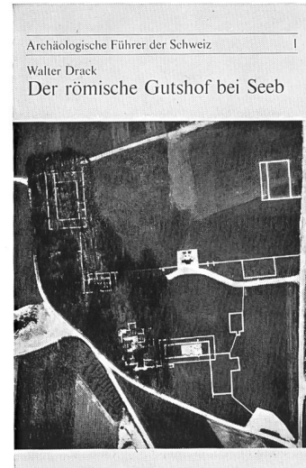
1: Der römische Gutshof bei Seeb , von Walter Drack 32 Seiten, 33 Abbildungen und Pläne. Preis: Fr. 2.50* Verkaufsstelle: Römervilla Seeb