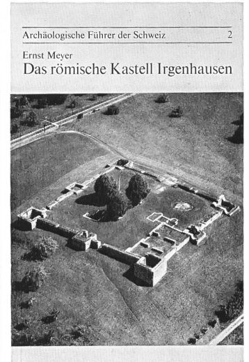
2: Das römische Kastell Irgenhausen , von Ernst Meyer 20 Seiten, 23 Abbildungen und Pläne. Preis: Fr. 2.-* Verkaufsstelle: Pfäffikon-Irgenhausen