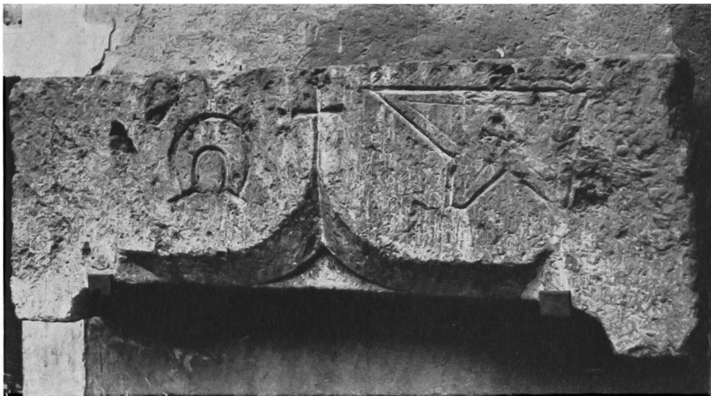
Abb. 57. Aosta, Museum. Spätgotischer Türsturz mit Hufeisen und Amboß.

daß diese Form über mehrere Jahrhunderte in Gebrauch war. Dem Fundinventar einer Ausgrabung auf der Burg Bellinzona im Jahre 1967 dürfen wir folgende Notiz mit Skizze (Abb. 56) entnehmen: