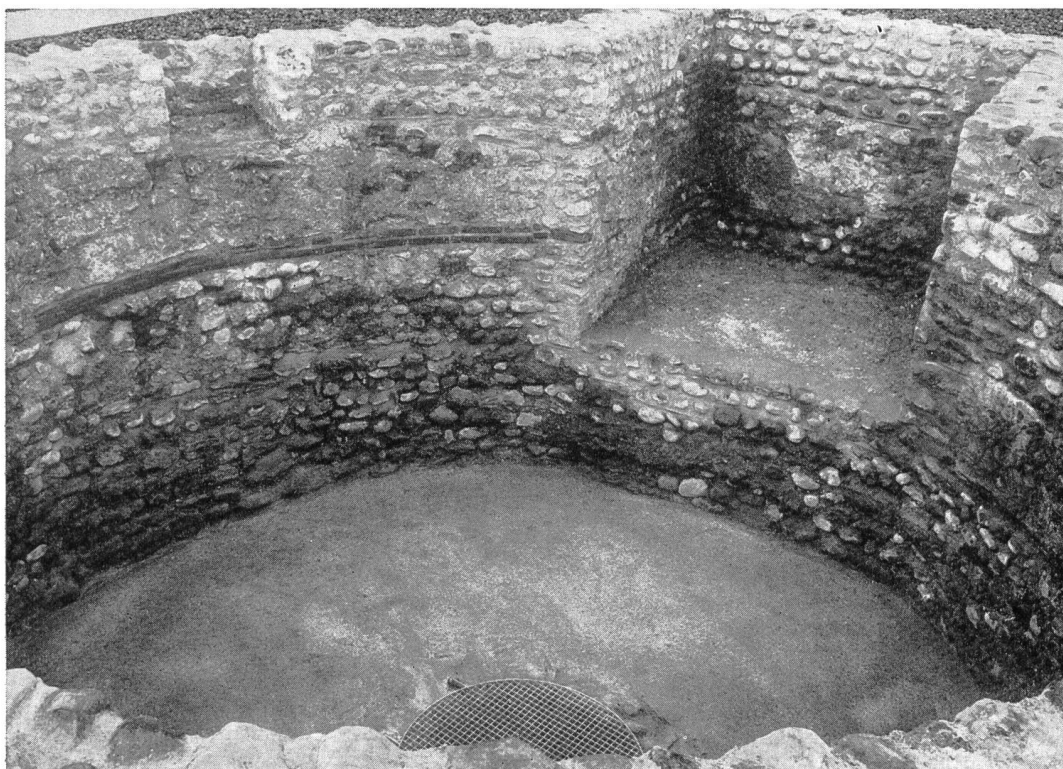
Abb. 78. Winkel ZH. Das römische Brunnenhaus bei Seeb. Nach der Konservierung im Frühjahr 1964. Aus Nordosten. Blick ins Innere, im Vordergrund der Sodbrunnen.