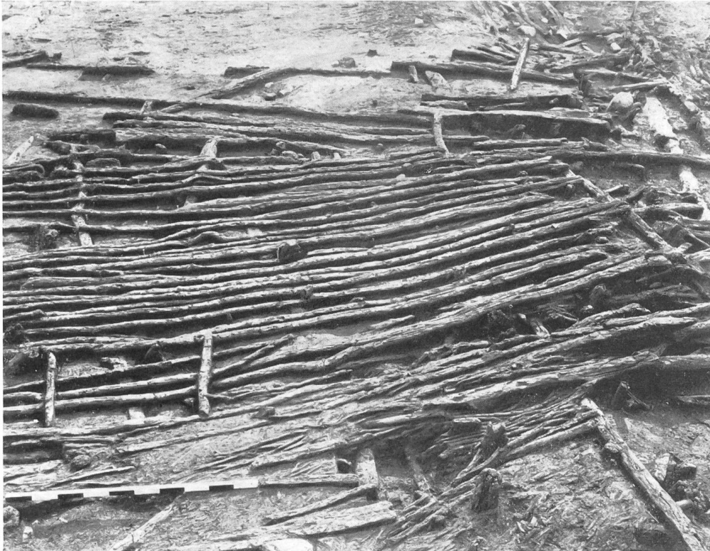
Abb. 25. Egolzwil 4. Hausbodenähnlicher Viehstandplatz aus den obersten Schichten der neolithischen Siedlung.

haus handeln. Da ein spezieller Prügelweg vom Haupteingang des Dorfes zu diesem Platze führte, ist trotz dem Fehlen von Fliegenpuppen anzunehmen, daß er als Viehstandplatz diente. Dieser ist wesentlich größer als die entsprechenden Anlagen an andern Stellen dieses Dorfes. In der Osthälfte des diesjährigen Grabungsareals kamen zwei Hausböden zum Vorschein, die entgegen der bisherigen Regel westöstlich orientiert waren. Es fragt sich, ob vielleicht auch dieser Umstand auf den unfernen Ostabschluß der Siedlung hinweist. Der eine Boden zeigte Längsstangenbelag auf Querunterzügen und eine sorgfältig angelegte Herdstelle in der Mitte der westlichen Schmalseite. Beim andern Boden bestand der Belag aus langen Weißtannenspältlingen ebenfalls auf Querunterzügen. Darauf lag wiederum eine Herdstelle. Eine wichtige Besonderheit konnte bei diesen beiden Häusern festgestellt werden, nämlich die, daß die Querunterzüge durch je drei Pfähle mit Kerbe auf ihrem Oberende gestützt waren. Die geringe Absenkung des Hausbodens im Verhältnis zum Oberende dieser Pfähle zeigt, daß ein Zwischenraum zwischen Hausboden und Moor kaum bestanden haben dürfte. Diese Stützpfähle dienten vielmehr dazu, ein einseitiges Absinken der Häuser im ungleich weichen Boden zu verhindern.