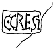
Fig. 12. Nyon, timbre du potier C. Crestius. Gr. nat.