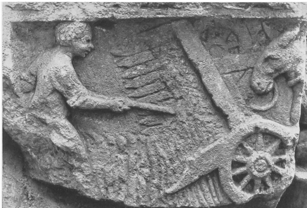
Fig. 46. Buzenol, Luxembourg. Relief romain avec représentation d'une moissonneuse.

culture écrit par Palladius; nous y lisons, livre VII, 2 3 : «Les habitants des pays plats de la Gaule ont une méthode de moissonner qui épargne la main-d'œuvre, puisqu'elle n'exige que la journée d'un bœuf pour expédier tout un canton. Ils ont un chariot monté sur deux petites roues. La surface de ce chariot, qui est carrée, est garnie de planches renversées en dehors, de sorte que sa partie supérieure est plus large que l'inférieure. Sur ces planches sont disposées par ordre de petites dents, fixées à la mesure des épis; ces dents sont recourbées par en haut. On adapte au derrière de ce chariot deux brancards très courts, semblables à ceux des litières dans lesquelles les femmes se font porter, et l'on