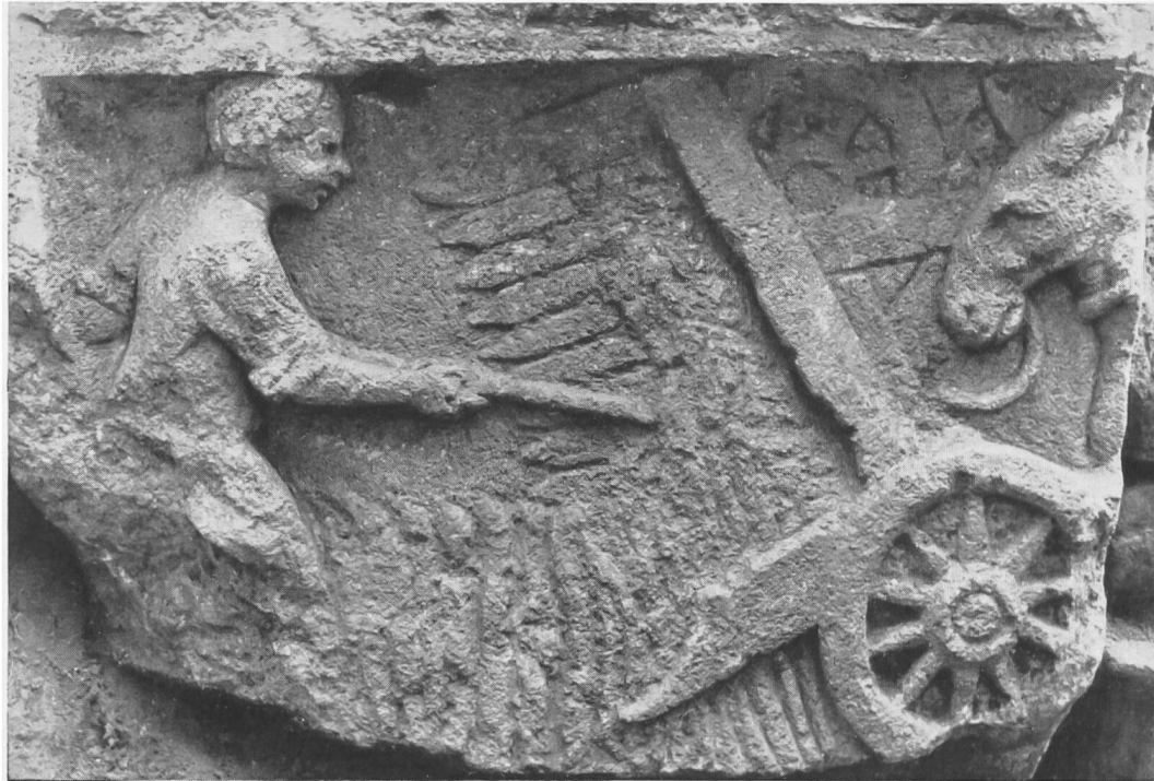
Fig. 46. Buzenol, Luxembourg. Relief romain avec représentation d'une moissonneuse.

culture écrit par Palladius; nous y lisons, livre VII, 2 3 : «Les habitants des pays plats de la Gaule ont une méthode de moissonner qui épargne la main-d'œuvre, puisqu'elle n'exige que la journée d'un bœuf pour expédier tout un canton. Ils ont un chariot monté sur deux petites roues. La surface de ce chariot, qui est carrée, est garnie de planches renversées en dehors, de sorte que sa partie supérieure est plus large que l'inférieure. Sur ces planches sont disposées par ordre de petites dents, fixées à la mesure des épis; ces dents sont recourbées par en haut. On adapte au derrière de ce chariot deux brancards très courts, semblables à ceux des litières dans lesquelles les femmes se font porter, et l'on