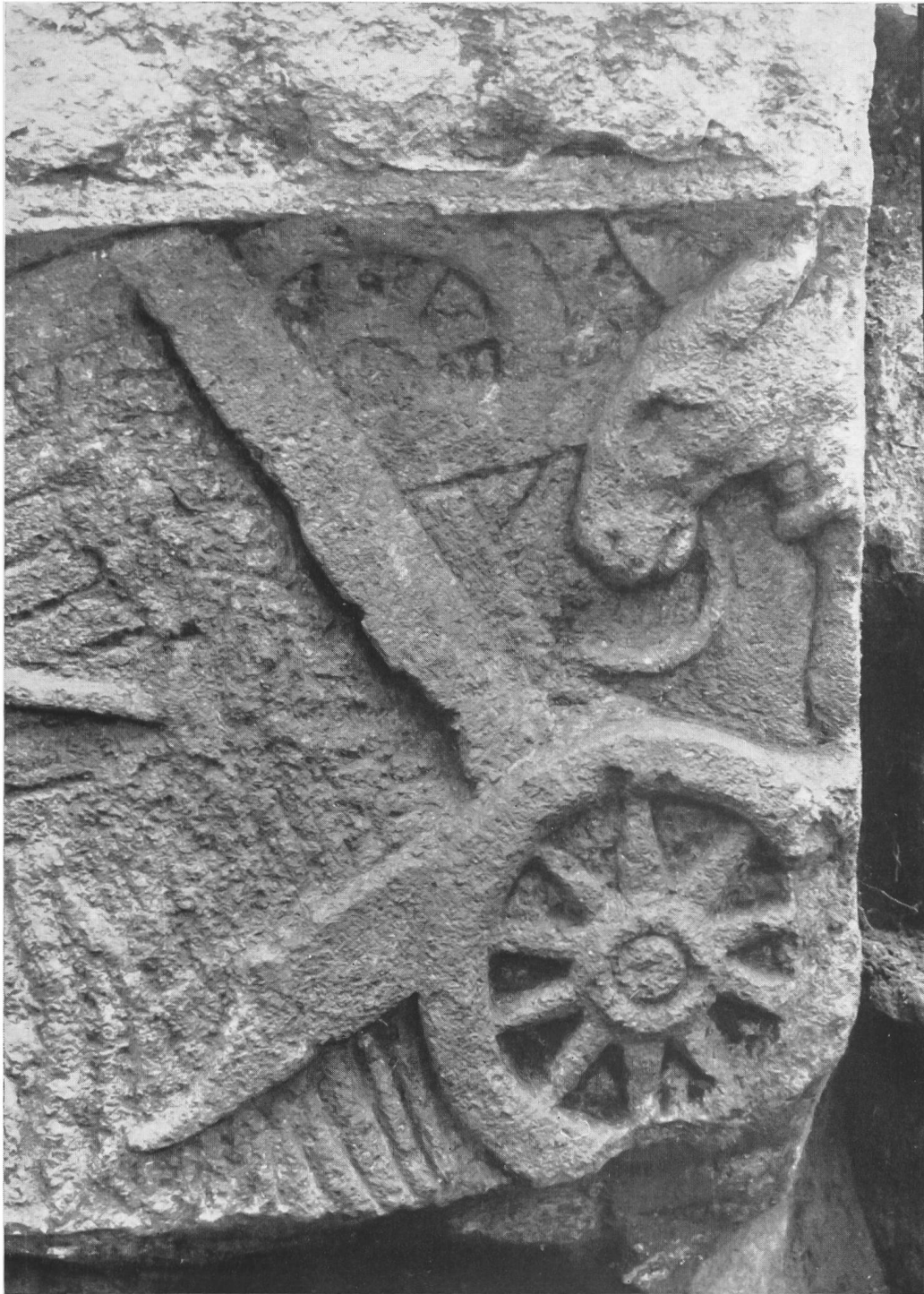
Fig. 47. Buzenol, Luxembourg. Détail du relief.