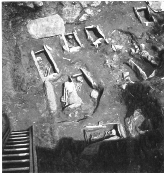
b. Barmaz II. Vue plongeante de sept des neuf nouvelles tombes néolithiques (7 à 13). La tombe 11 a subi anciennement un glissement qui l'a séparée en deux.