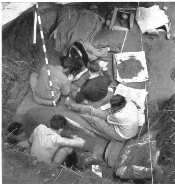
Fig. 36a. Collombey, la Barmaz II. Tombes néolithiques. Entre deux averses, on s'affaire délicatement autour de deux tombes.