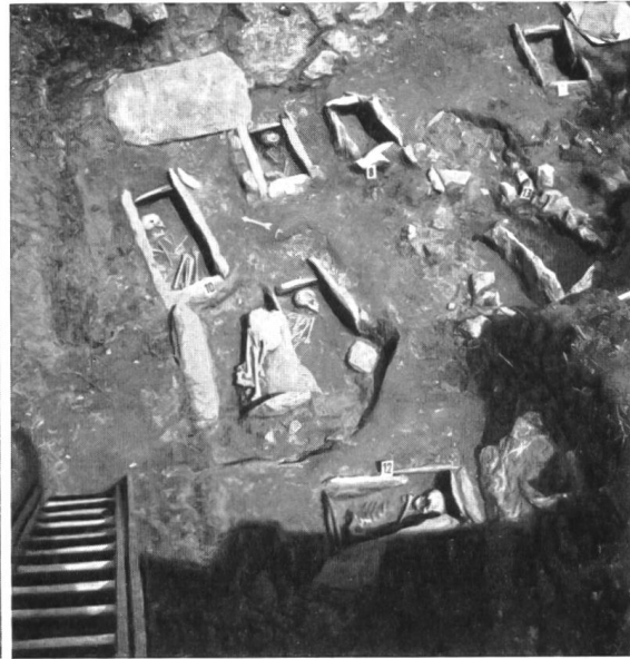
b. Barmaz II. Vue plongeante de sept des neuf nouvelles tombes néolithiques (7 à 13). La tombe 11 a subi anciennement un glissement qui l'a séparée en deux.