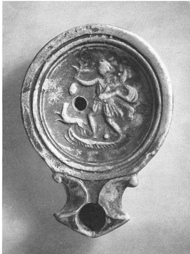
Abb. 11. Vindonissa. Öllampe mit Darstellung des Gottes Merkur auf Schiff.

ziehungen, die das Ganze, so klein es auch sein mag, zu einer künstlerischen Komposition von bemerkenswerter Qualität gestalten. Der Schluß liegt nahe, im Vorwurf zu dem Bildchen ein Werk der großen Kunst und zwar der Malerei zu vermuten.