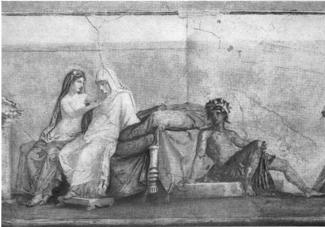
Abb. 14. Rom. Mittelbild der aldobrandinischen Hochzeit (nach A. Maiuri, Pomp. Wandbilder, Taf. I).

Trauer, sondern banges Zögern vor dem kommenden Erlebnis. Hymenaios, der kraftvolle Jüngling und ernstere Bruder des Eros, hat sich zu ihr gesetzt, um ihr zuzureden und den Bann ihres Herzens zu lösen.