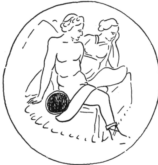
Abb. 12. Augst. Bild auf der Öllampe.

So wird Hymenaeus, der Hochzeitsgott, von der Jugend, die den Brautzug auf der Straße begleitet, angerufen und beschrieben: Er trägt als Symbol den roten Schleier und den rot-goldenen Schuh der Braut; seine Aufgabe ist es, die blühende Jungfrau aus dem Schoße der Mutter in die Arme des Jünglings zu führen, wie es in Vers 56 des Hymnus weiter heißt.