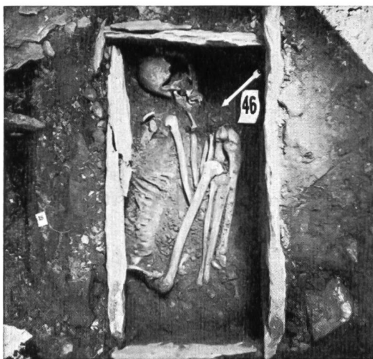
Fig. 33. Collombey-Barmaz I. Tombe néolithique n° 46, au squelette fortement replié.

Si les fouilles de 1950 n'ont pas amené de découverte originale, elles n'en ont pas moins été utiles. Elles ont permis d'augmenter le nombre des tombes néolithiques de quatre (fig. 33-34) et de celles du Bronze d'une (fig. 35), et de délimiter, du côté SE, la nécropole de Barmaz I (seule fouillée cette année).