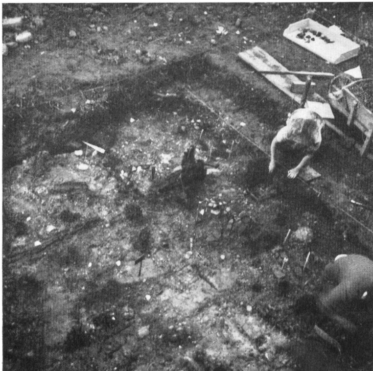
Fig. 2. Auvernier. Décapage du niveau I. Pilotis et bais couchés.