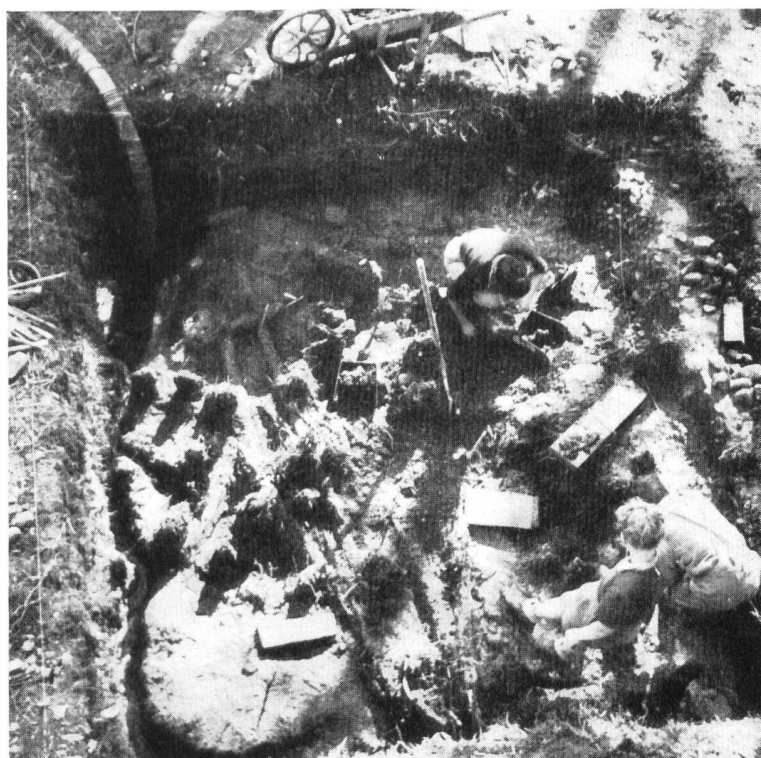
Fig. 3. Auvernier. Décapage du niveau II. Pilotis et bais couchés.