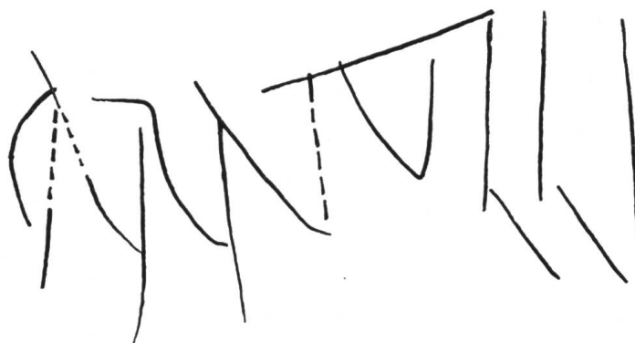
Fig. 10. Yverdon. Graffite CARATULLI sur cruche.