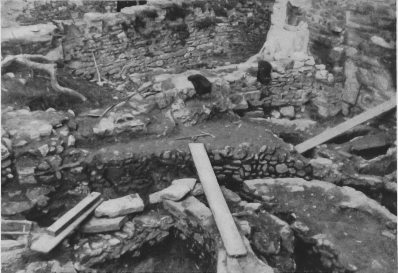
Fig.43. St. Maurice. L'enchevêtrement des murs au pied de la tour.

les historiens. Les fouilles faites à l'abbaye jusqu'en 1916, sous la direction de M. le chanoine P. Bourban, ont montré dans la cour dite du „Martolet“, située entre le clocher, l'abbaye et le rocher, la superposition de plusieurs basiliques très anciennes et l'existence d'une crypte avec un tombeau romain considéré comme celui de S. Maurice. Malheureusement ces fouilles non terminées n'ont pas permis d'élucider le plan complet et la succession historique de ces divers édifices. Cependant ces fouilles ont laissé apercevoir l'existence d'une suite continue de constructions qui s'échelonnent de la fin de l'époque romaine jusqu'au XVII e siècle. Au moins sept à huit plans d'églises superposées avec des couloirs souterrains, dits catacombes, ont été mis à découvert.