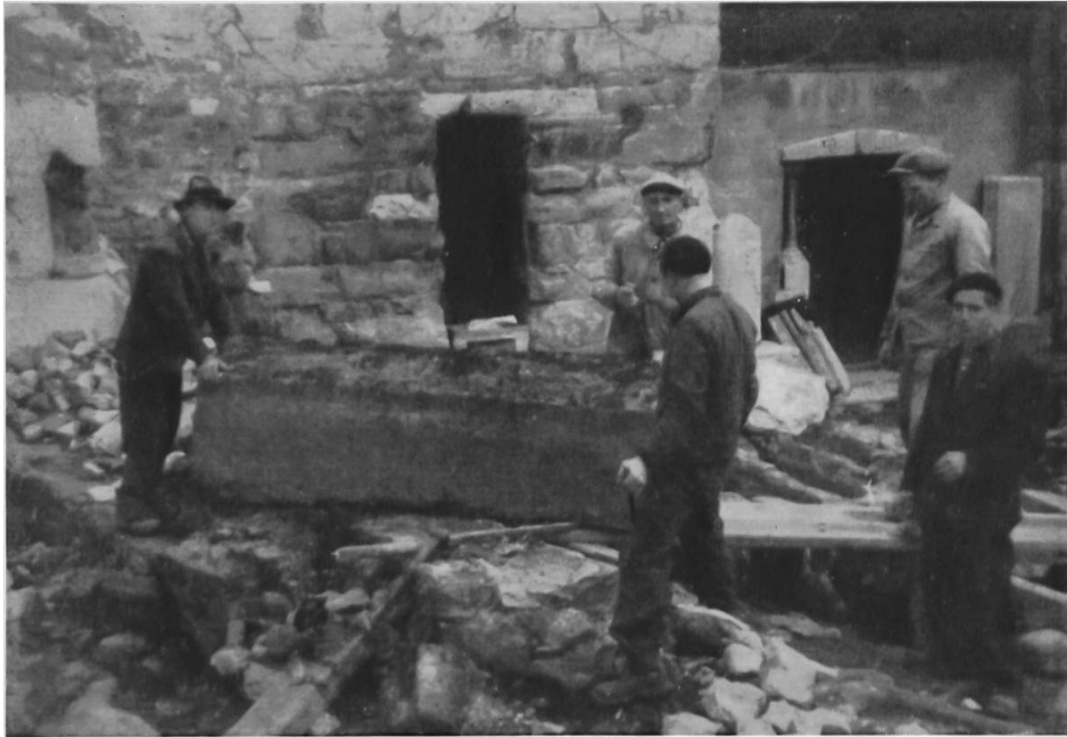
Fig. 45. St. Maurice.