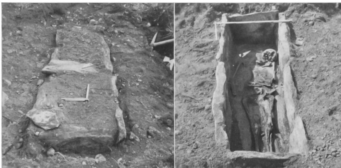
Fig. 29. Bassins (Vaud). Tombe burgonde.