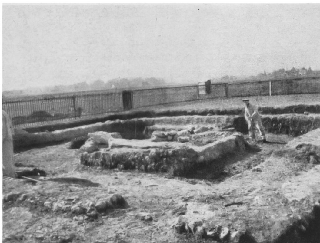
Fig. 25. Wavre, Mausolée. Vue d'ensemble.