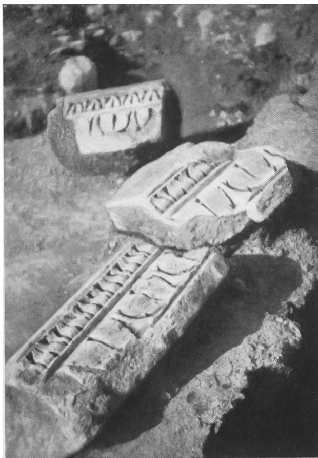
Fig. 24. Wavre, Mausolée. Fragments architecturaux.