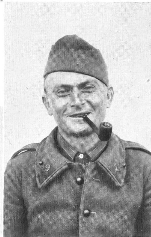
Fig. 30. Types d'Internés français qui travaillent à Avenches.