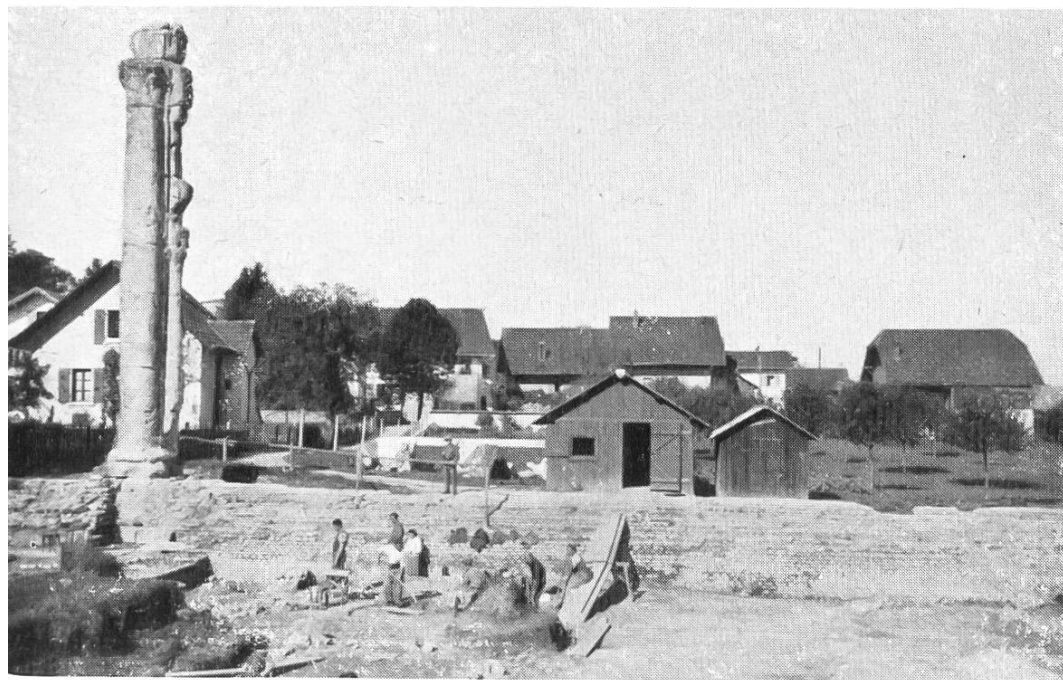
Fig. 29. Avenches. Les fouilles au Sud-Est du Cigognier.