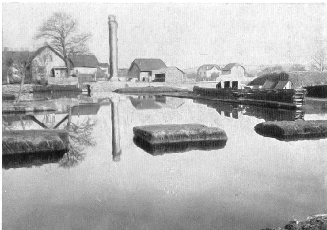
Fig. 27. Avenches: Cigognier et 'Pastlac' avant l'assainissement.

Au point de vue scientifique, l'exécution du collecteur permit de situer un certain nombre de constructions, plusieurs