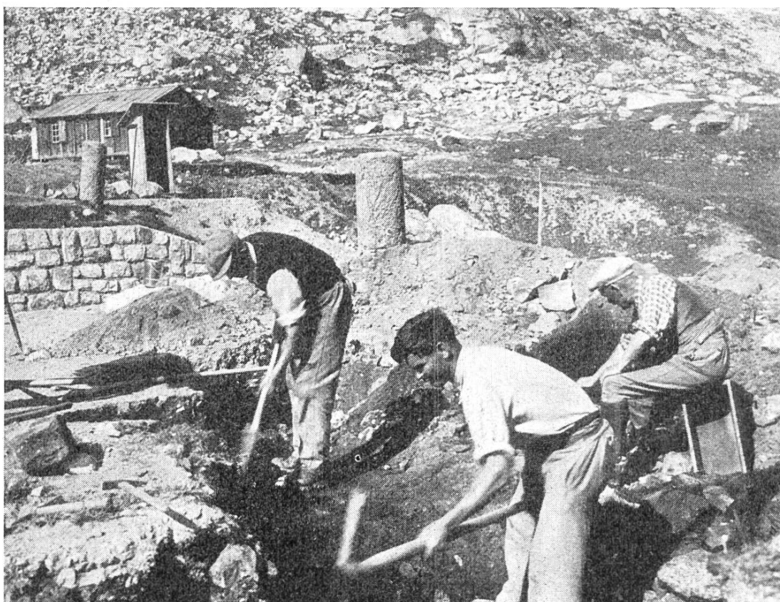
Abb 32. Julierpass. Im August 1939 führte die Hist.-Antiq. Gesellschaft Graubünden unter Leitung von Obering. H. Conrad neue Sondierungen bei den römischen Säulen durch, die weitere Anhaltspunkte für die Rekonstruktion des Passheiligtumes ergaben. Die beiden Säulen sind auf dem Bild gut sichtbar.