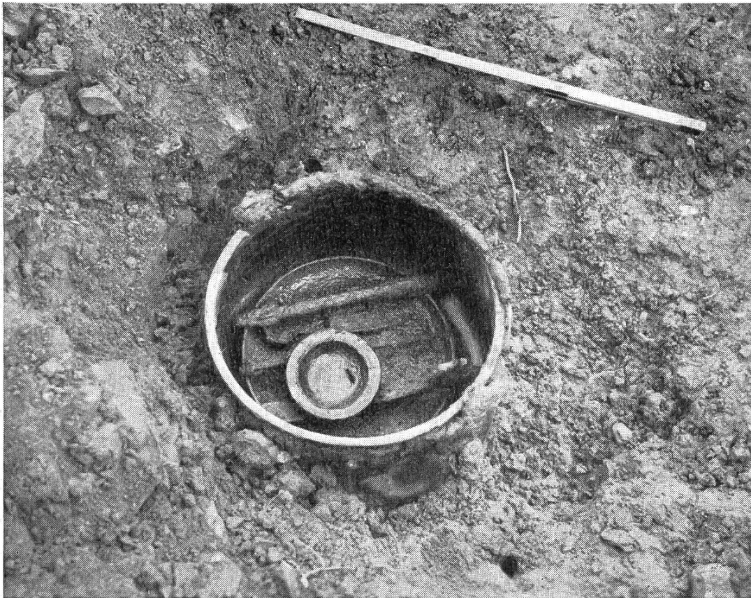
Abb. 24. Entfelden: Bronzegeschirrdepot aus römischen Kriegszeiten.

von Dr. Paul Ammann aus Aarau mit Notstandsarbeitern von Muhen diesen Herbst wieder aufgenommen worden. Ueber die topographischen Ergebnisse werden wir in der nächsten Nummer berichten. Für heute möchten wir unsere Leser nur mit einem originellen Neufund bekannt machen. Abbildung 24 zeigt einen römischen Bronzekessel, der im Boden vergraben war und ein ganzes Depot von Bronzegefäßen und Werkzeugen enthielt. Offenbar hat ein durch kriegsrische Ereignisse verängstigter Bewohner des Hofes diese ihm wertvollen Gegenstände der Erde anvertraut und wurde durch das Schicksal verhindert, den Schatz wieder zu heben. Solche Bronzegeschirrdepots sind übrigens nicht einmal so selten. Aehnlich wie die Münztöpfe vermögen sie der Forschung Auskünfte über die Zeit und den Verlauf alamannischer Kriegszüge in die römische Schweiz zu geben.