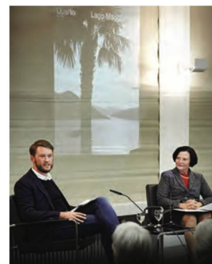
Vernissage of Quarto no. 45, with an image of the journal's cover in the background