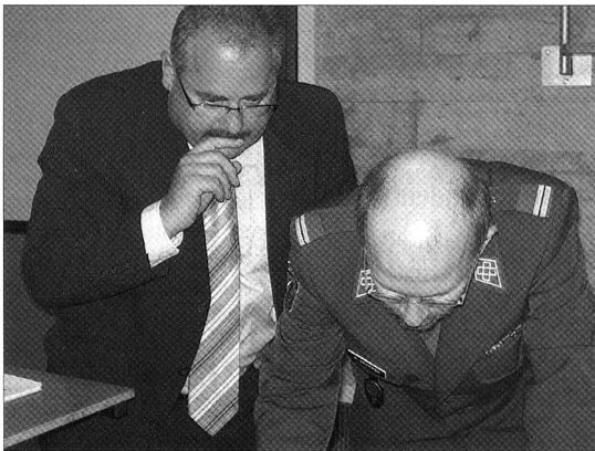
Mögen die Situationen noch so knifflig gewesen sein (links), unter anderen sorgen die drei Mitglieder der Sektion Romand für einen reibungslosen Ablauf der Veranstaltung.

BERN. – nlz. Die Schweizer Armee hat nach einer Häufung von Pannen einen neuen Fallschirm aus einer US-Produktion aus dem Verkehr gezogen. Bei 2500 Absprüngen öffnete sich der Fallschirm in 12 Fällen nicht. Zu Unfällen sei es nicht gekommen, da der Notfallschirm ausgelöst worden sei.