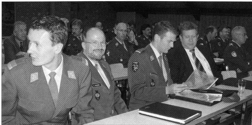
Auch an der 11. Mitgliederversammlung der SOLOG herrschte eine gute Stimmung; quasi unter dem Motto des Gradverbandes: «Der Tradition verbunden. Für den Wandel der Zeit offen. Aber immer der Gemeinschaft verpflichtet.»