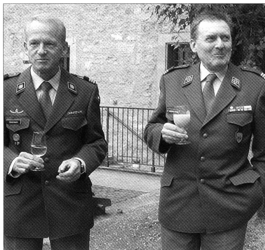
Mögen doch die Diskussionen beim Apéro noch so intensiv zwischen Mann und Frau gewesen sein, zogen sich andere in den Hintergrund und bevorzugten ein Stelldichein unter sich. Das ist gelebte Miliz, wie sie leider in unserem Land zuwenig erlebt wird.