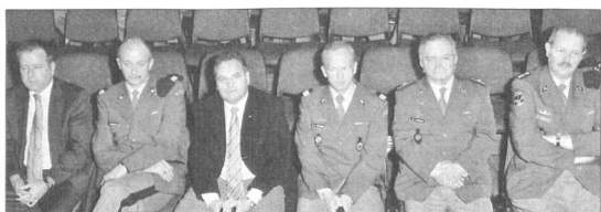
Zahlreiche Gäste wohnten der Beförderungsfeier bei.

Traurig stimme ihn auch die Tatsache, dass immer weniger junge Leute bereit seien, eine RS zu absolvieren. «Aber die Gesellschaft hat sich gewandelt. Das egoistische Denken breitet sich aus. Es ist heute eben nicht mehr so modern, jemandem zu dienen, schon gar nicht dem Vaterland.»