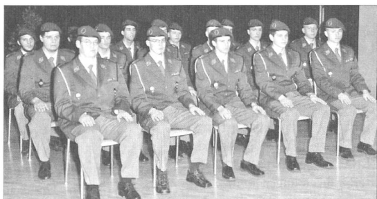
Die Beförderten: drei Fouriere, zwei Hauptfeldweibel und zwölf Wachtmeister.