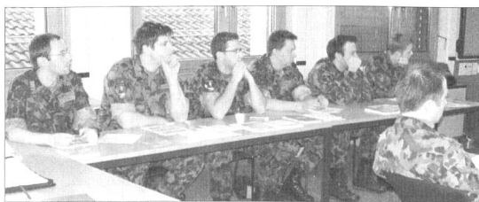
Interessierte Quartiermeister auf der Schulbank. Weitere Bildimpressionen finden Sie auf der dritten Umschlagseite in dieser Ausgabe von ARMEE-LOGISTIK.

Nachschub/Rückschub lernten die neuen Prozesse für Auf-