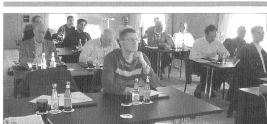
Les membres de l'ARFS et de la SSOLOG de retour sur les bancs de classe.

La journée s'est poursuivie par la visite du Musée de l'alimentation de Vevey, une fondation Nestlé créée en 1980, qui propose une découverte passionnante des multiples aspects de l'alimentation, de manière vivante et dynamique. Ce musée est composé de 4 secteurs ayant pour titre un verbe alimentaire: CUISINER, MANGER, ACHETER et DIGERER, ainsi que d'un ESPACE NESTLÉ, unique salle historique du bâtiment, construit immédiatement après la Première Guerre mondiale pour être le premier siège administratif de Nestlé. En passant d'un thème à un autre, notre charmante guide nous a fait découvrir les différentes habitudes alimentaires, l'évolution des ustensiles de table, les différentes transformations qui rendent les aliments consommables et per-