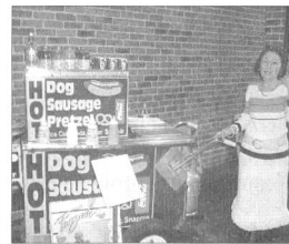
Notre sympathique guide nous présente le pushcart.