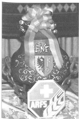
La marmite garnie de 3,0085 kg.

Notre président salua en particulier un ancien qu'on n'avait