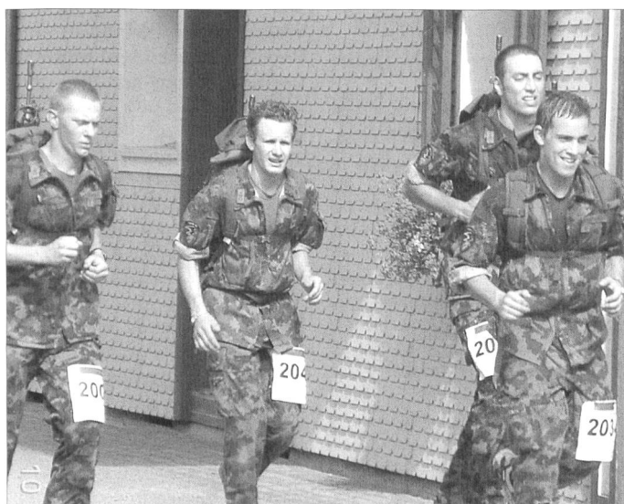
Wo liegt die persönliche Leistungsgrenze? Diese Frage musste sich jeder Offiziersanwärter fast täglich stellen.

-r. Und schon sind wieder Logistik-Offiziersanwärter in der ganzen Schweiz unterwegs. Denn am Freitag 9. Februar findet im Casino in Bern die Beförderungsfest der Schule 1/06-07 statt.