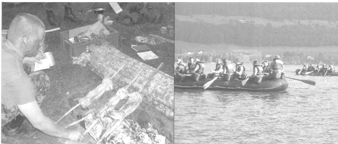
Heute könnten Sie alle Absolventen der Log OS 3-06 fragen, ob sie die Strapazen dieser Kadernschule nochmals auf sich nehmen würden. Die Antwort käme wie aus dem Stegreif: «Natürlich!».