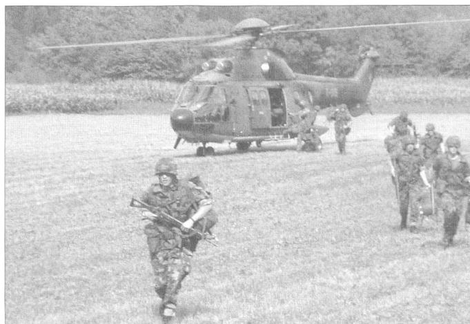
Ein besonderes Erlebnis: Der Flug mit dem Super-Puma.

Ich lasse nun die Zeit an der OS Revue passieren. Die DHU liegt knapp eine Woche hinter mir und diese Übung hat mich und meine Kameraden sicherlich gefordert. Wenig Schlaf, sehr spezielles Essen und auch die körperliche Betätigung kam nicht zu knapp. Veloverschiebungen, Märsche, Waffenläufe, der Flug mit dem Super Puma und vieles mehr stand auf dem Programm. Das