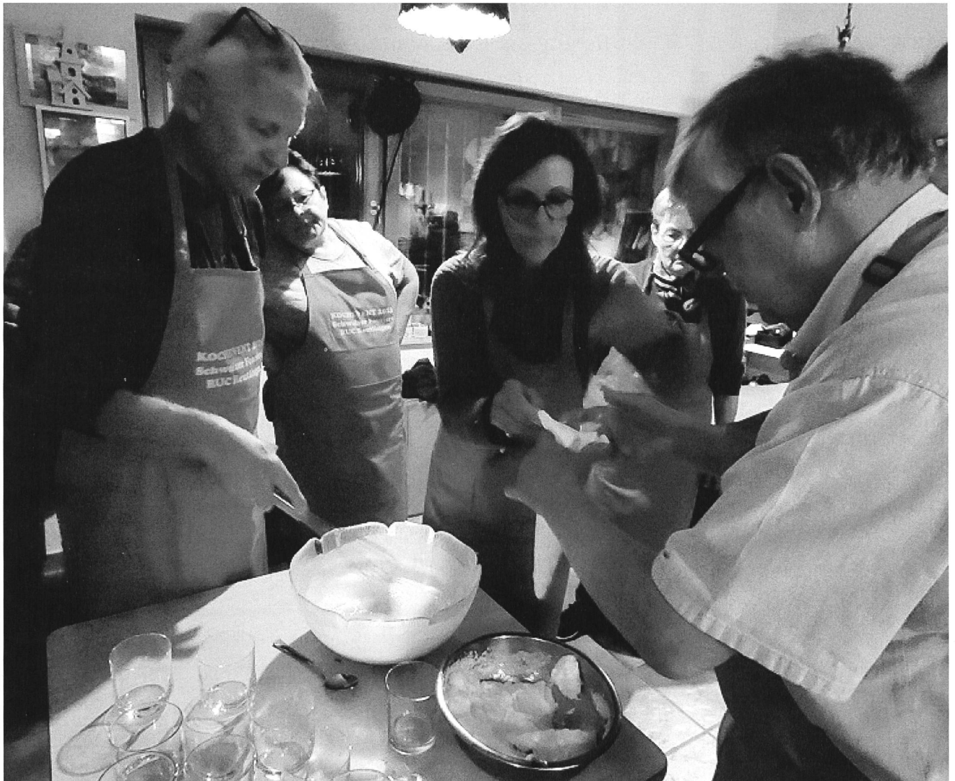
Beim Zubereiten des Desserts «Zitronen-Baiser-Mousse».