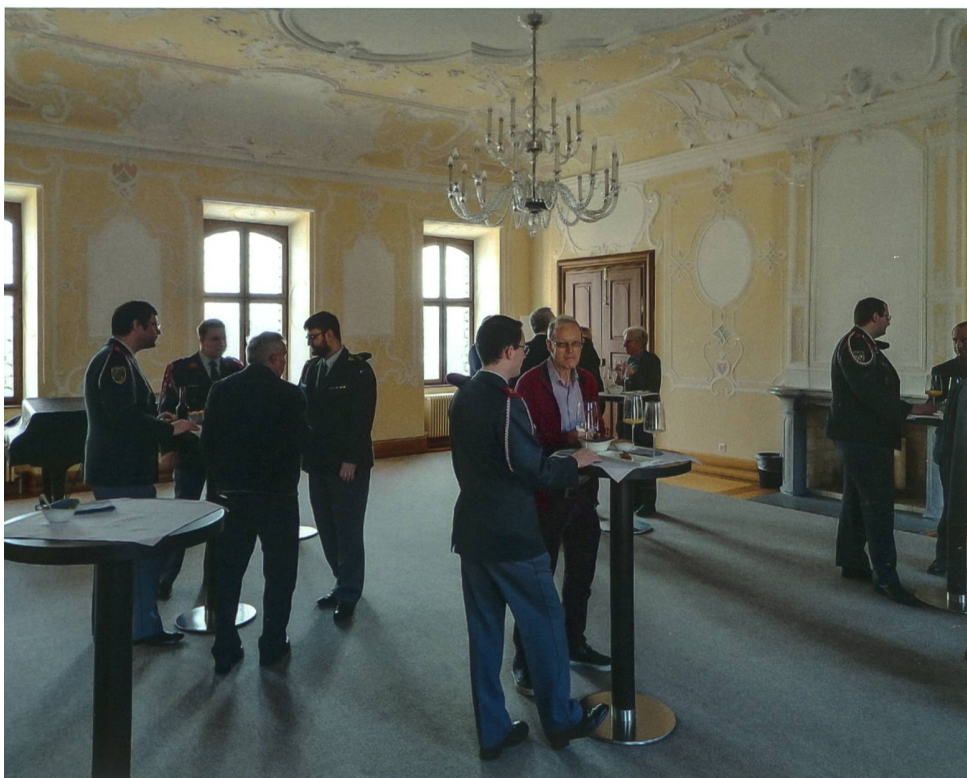
Apéro im Rittersaal des Seminarzentrums Hitzkirch